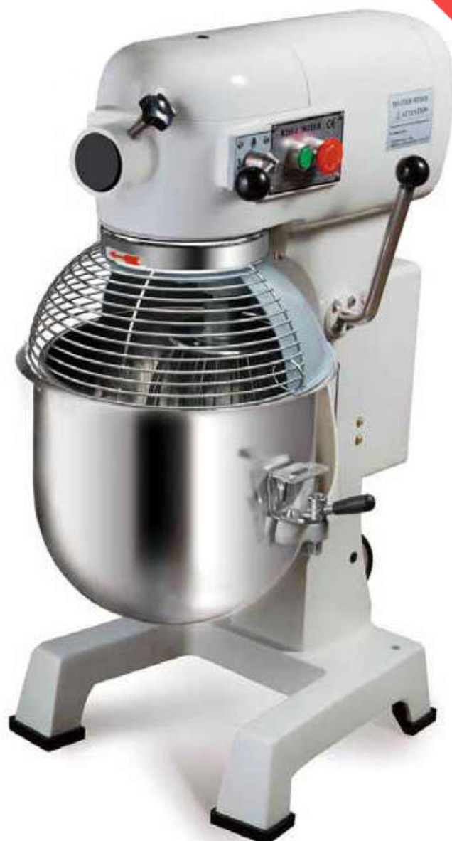
Három árban foglalt kiegészítővel